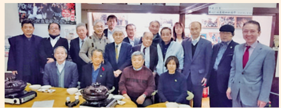
岩村田本町商店街直営の三月九日青春食堂にて

2日目は、軽井沢銀座商店街、小諸ワイナリー、松代象山地下壕を見学、とても有意義な研修でした。