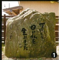
1 句碑 生家跡（喜多義教宅）

金沢第七連隊入隊後、「無産青年」持ち込みにより、赤化事件として懲役2年の判決を受け大阪城内の衛戍監獄に投獄される。除隊後約4年間、反戦・反権力の川柳、貧困との戦いに終始するが、昭和12年12月、大阪の川柳人「三味線草」の森鷗牛子の密告により検挙される。東京・野方署に収監のまま豊多摩病院で昭和13年9月14日、無念の死を遂げた。骨は兄の孝雄が引き取り、現在、岩手県盛岡市の光照寺の墓に眠っている。